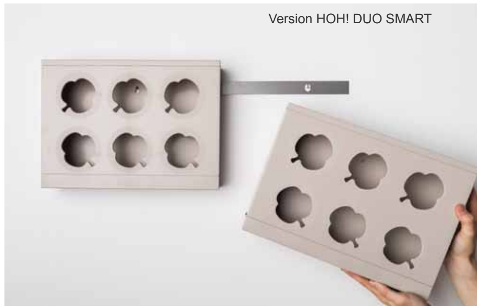
Version HOH! DUO SMART

ist in weiß, grau und schwarz verfügbar und kann mit Firmenlogos, Farben, Grafiken, Texturen und Lettering personalisiert werden. HOH! kann für Kommunikations- und Werbungszwecke verwendet werden, bzw. als Geschenkartikel für Firmen oder als Produkt für bestimmte Kunden. Es kann außerdem für Veranstaltungen aller Art angepasst werden. Sie können auch mehrere Kompositionen von HOH! mit preiswerten Spanneisen oder durch die speziellen vertikalen und horizontalen Strukturen "DUO" und "TRIO" (siehe Bilder auf der nächsten Seite) erstellen. Die einzelnen Teile von HOH! werden durch Gleiten innerhalb der Struktur angeordnet; Wartung und Bewässerung erfolgt in gleicher Weise. Schließlich etwas ganz Neues: bHOH!nsaiArtKami setzt den neuen Trend des vertikalen Grünen und die alte Kunst des Bonsai zusammen.