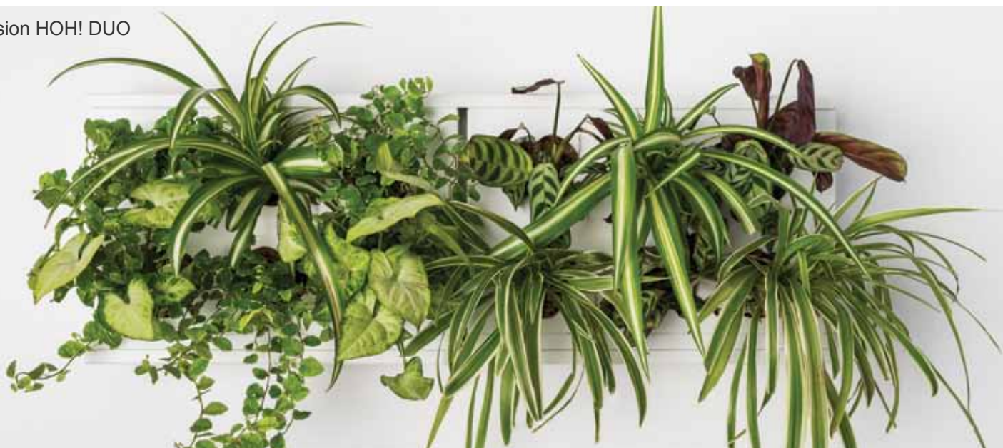
Version HOH! DUO

Es eignet sich für die Innen-Dekoration und Einrichtung von allen gewerblichen und öffentlichen Wohnbereich. Möglichkeit der modularen spezifischen Ausführungsformen